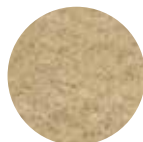
Neutraal Art. nr. 102001