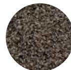
Basalt Art. nr. 102003