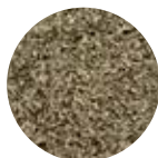
Steengrijs Art. nr. 102002