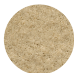
Neutraal Art. nr. 103001